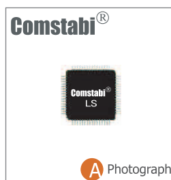
A Photograph A デバイス本体